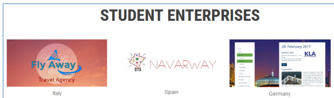
Abbildung IO3_5_2: Schülerfirmen in Italien, Spanien und Deutschland (Erasmus+, Projekt PACE, siehe https://blogs.uni-bremen.de/pace/ )